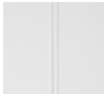
Fertige Hartverfugung (komplette Aushärtung nach ca. 72 Stunden)

Bitte beachten Sie vor Beginn der Verfugungsarbeiten unsere ausführliche Verarbeitungsanleitung!