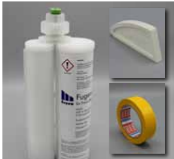
Fugenmasse, Glättfix und Klebeband