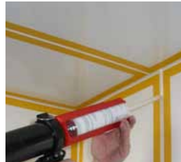
Einbringen der Fugenmasse in die Fuge