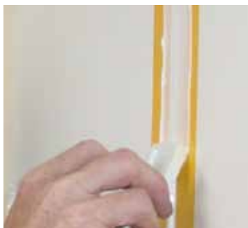
Fugenmasse mit Glättfix glätten; Flankenhaftung auf der GFK-Deckschicht beachten