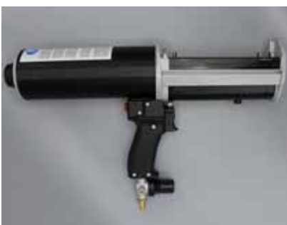
▲ Pneumatische Handpistole